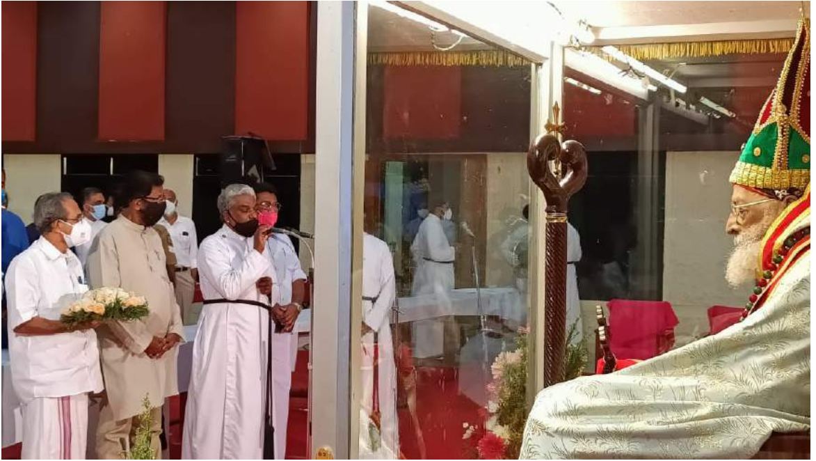
ഡോ. ഫിലിപ്പോസ് മാർ ക്രിസോസ്റ്റം മാർത്തോമ്മാ വലിയ മെത്രാപ്പോലീത്തായ്ക്ക് സന്നദ്ധ സുവിശേഷക സംഘത്തിന്റെ പ്രണാമം